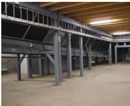
Transportör från Möckeln.

När det blåser motvind i den svenska industrin satsar Gyllsjö på att utveckla verksamheten. Ett litet familjeföretag med gedigen