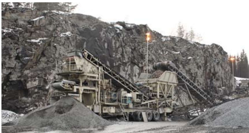
Kross- och sorteringsanläggning med Möckelns siktar och transportörer.

Det finns entreprenörsanda och tekniskt kunnande i mängd hos Eiton och hans personal. I verkstaden i Obbhult finns kompetens att sköta det mesta när det gäller underhåll och reparationer. Vid behov kan man även bygga maskiner. Det senaste projektet är en hjulburen förkrossvagn, som utrustats med transportörer från Möckeln.