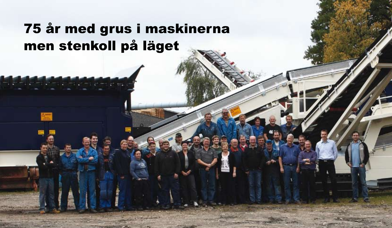
Anställda på Möckeln.

Möckeln firar 75-årsjubileum i år. Vi är mycket stolta över att under en hel mansålder ha fått förtroendet från våra kunder att leverera kvalitetsprodukter för krossning, sortering, återvinning och materialhantering. I denna jubileumstidning vill vi ge både nuvarande och nya kunder, samt andra som är intresserade av bolaget, en beskrivning av vad Möckeln står för.